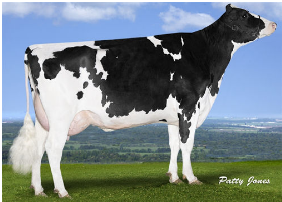
PROGENESIS ENFORCER PAT FIFTH DAM